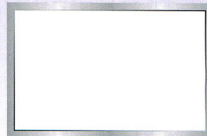
P-30 H900×W800/H600×W900/H450×W900 ホワイトボード、アルミ枠付