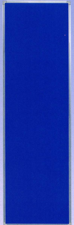
B-5B H2000×W600 ポリエステル加工、アルミ枠仕上、4枚貼り用、無地