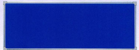
B-6B H450×W1200 ポリエステル加工、アルミ枠仕上、2枚貼り用、無地