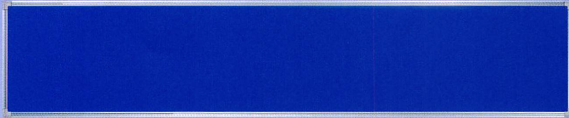
B-1B H450×W2200 ポリエステル加工、アルミ枠仕上、4枚貼り用、無地