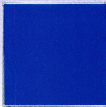
B-7B H950×W950 ポリエステル加工、アルミ枠仕上、無地