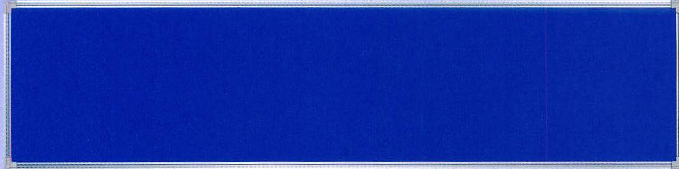
B-2B H450×W1800 ポリエステル加工、アルミ枠仕上、3枚貼り用、無地